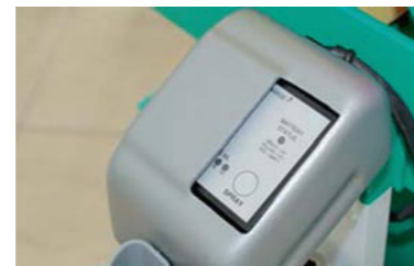
Optionale Abdeckung – zum Schutz vor unsachgemäßem Gebrauch.