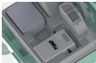
Dosiereinheit mit elektrischer Pumpe und Gelbatterie (Ladezeit 6–8 h).