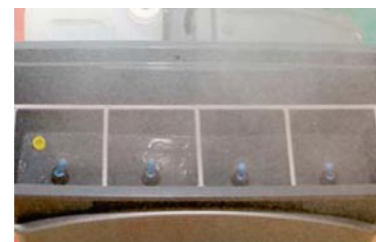
Vier justierbare Sprühdüsen.