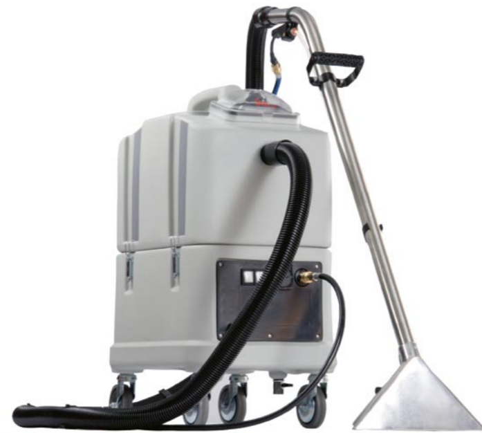
Spray X 30