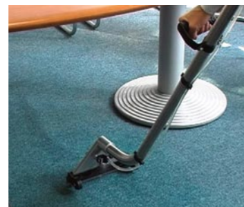
Stabile S-förmige Edelstahlrohre bei allen Modellen.