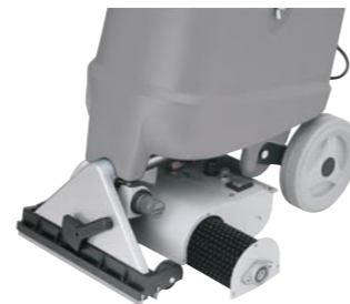
Spray X 12 brush: leicht wechselbare Teppichbürste.