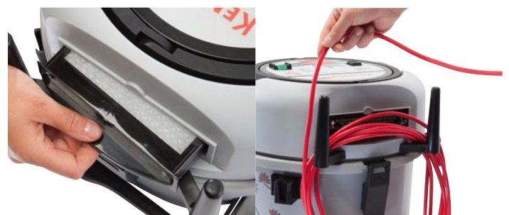
Kassettenfilter/Abluftfilter – einfach zu wechseln, mit einzigartiger Farbkodierung. Standard (schwarz), HEPA (rot) und ULPA (blau).