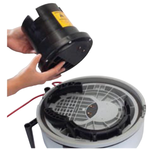
Werkzeugloser Wechsel des Saugmotors.