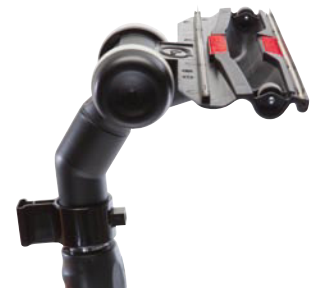
Ergo-Bodendüse aus Nylon, daher elastisch und super flach.