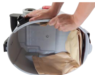
Sehr robuster Kessel.