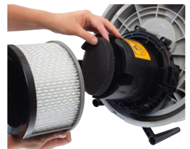
Motorschutzfilter einfach zu wechseln mit einzigartiger Farbkodierung.