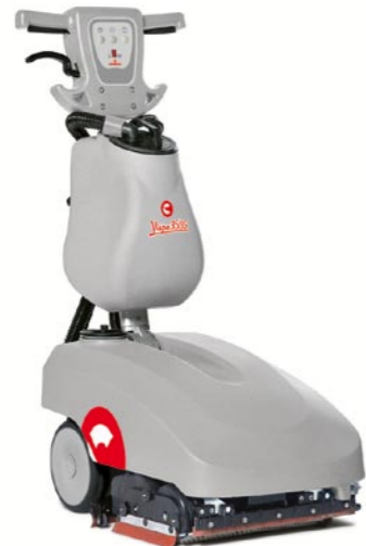
Vispa 35 BS