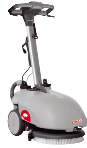
Vispa 35 E plus

Die Vispa 35 BS schrubbt und kehrt gleichzeitig. Zudem nimmt sie das Wasser auch in der Rückwärtsbewegung auf, also auch unter Tischen oder Betten. Ideal auch auf strukturierten Böden.