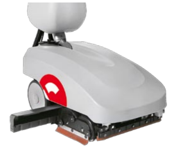
Kleinere Gegenstände werden durch die Walzentechnik mit aufgenommen. Der integrierte Grobschmutzbehälter ist leicht entleerbar.