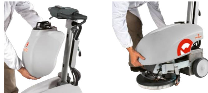
Vispa 35 B und 35 BS: Der Schmutzwassertank (links) kann einfach abgenommen werden; ebenso der Frischwassertank (rechts).