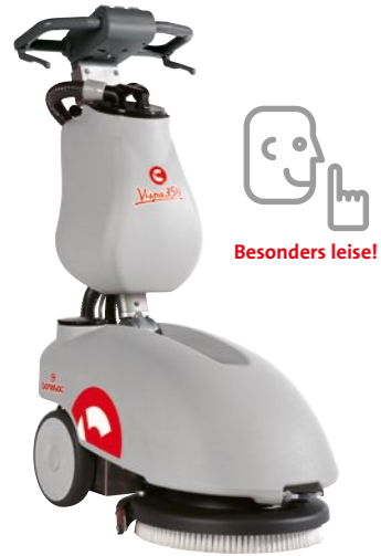
Vispa 35 B