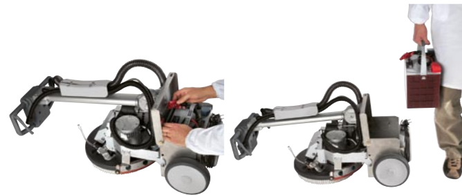
Vispa 35 B und 35 BS: Die Batterie kann in weniger als einer Minute werkzeuglos gewechselt werden.