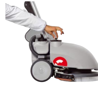
Einfache Befüllung des Frischwassertanks.