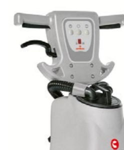
Überarbeitetes Bedienpult. Ergonomischer und einfacher zu bedienen. Die stabile Bauweise sorgt für eine längere Lebensdauer.