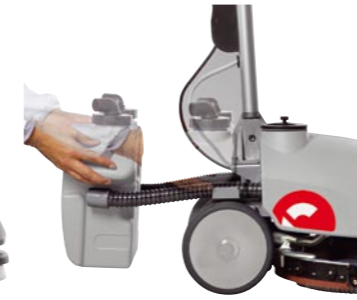
Magnetisch fixierter Schmutzwassertank werkzeuglos abnehmbar.