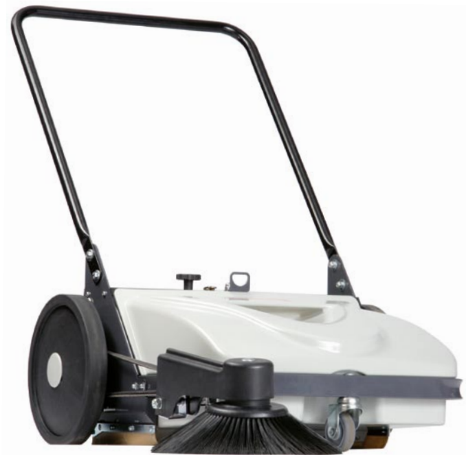
Sweep 5 plus

Konventionelle, extrem leistungsfähige, robuste und stark absaugende Kehrmaschine mit traditionellem Überkopf-Prinzip.