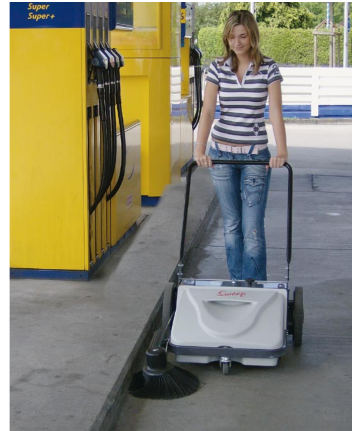
Sweep 5 plus – mechanisch und doch mit Absaugung.