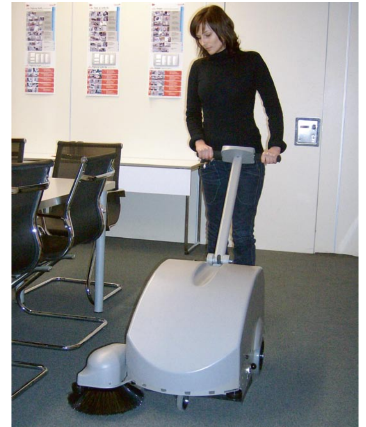
Sweep 41 – auch zum Teppichkehren.