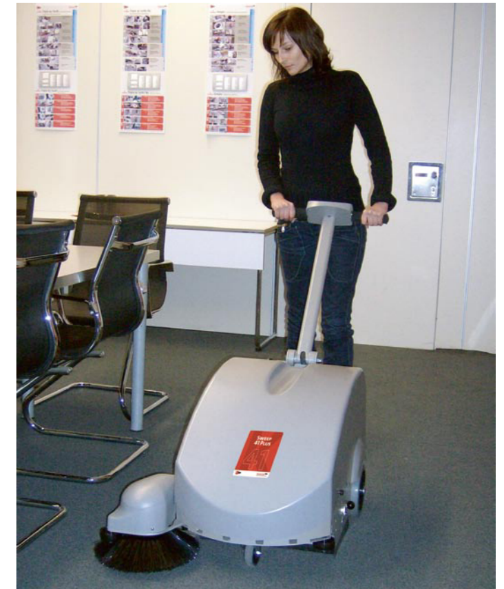
Sweep 41 Plus – auch zum Teppichkehren.