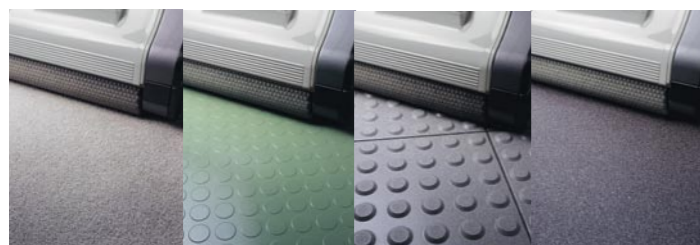
Für Teppich-, Noppen- und Sicherheitsböden.