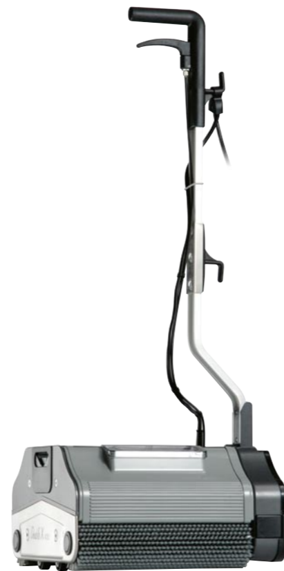
Double X 340