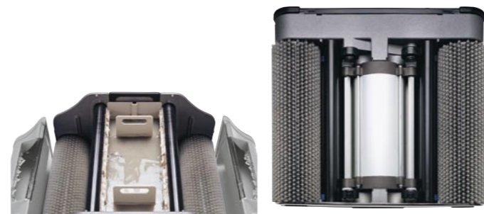
Zwei Frischwassertanks. Ein Schmutzwassertank.