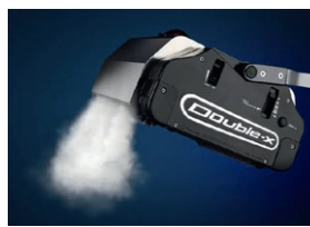
Starker Dampfstrahl – ohne Chemie.